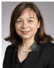
Catherine BARATTI-ELBAZ, Maire du 12e arrondissement